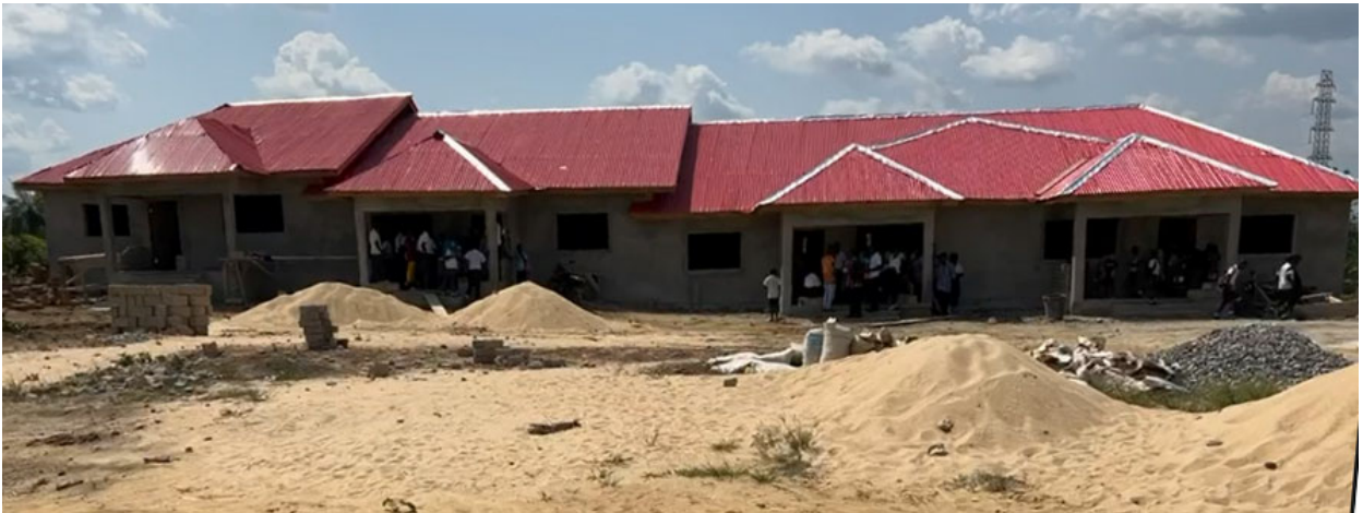
Lærerboliger som landsbyen selv har skaffet penger til. Det viser de gode ringvirkningene av vårt arbeid.

The Frank Diggs Public School located in Grand Bassa County is accounting for One Hundred Twenty-Five (125) students who benefitted from all of the items mentioned above. The library is being utilized by both the students, faculty and administration. Due to the improvement made in the school by different organizations, especially GHTAC and Mary Meal, who are providing school supplies, uniforms, providing financial aid for students, and providing meal for the kids, the enrollment at this school has increased to Three Hundred Plus Students. Due to the student population, and the distance some teachers covers to reach to the school in the morning, a concessional company working in Bassa has built four apartments for outstation teachers, as their social responsibility to the community. Even though the issue for additional paid government teacher remains a concern.