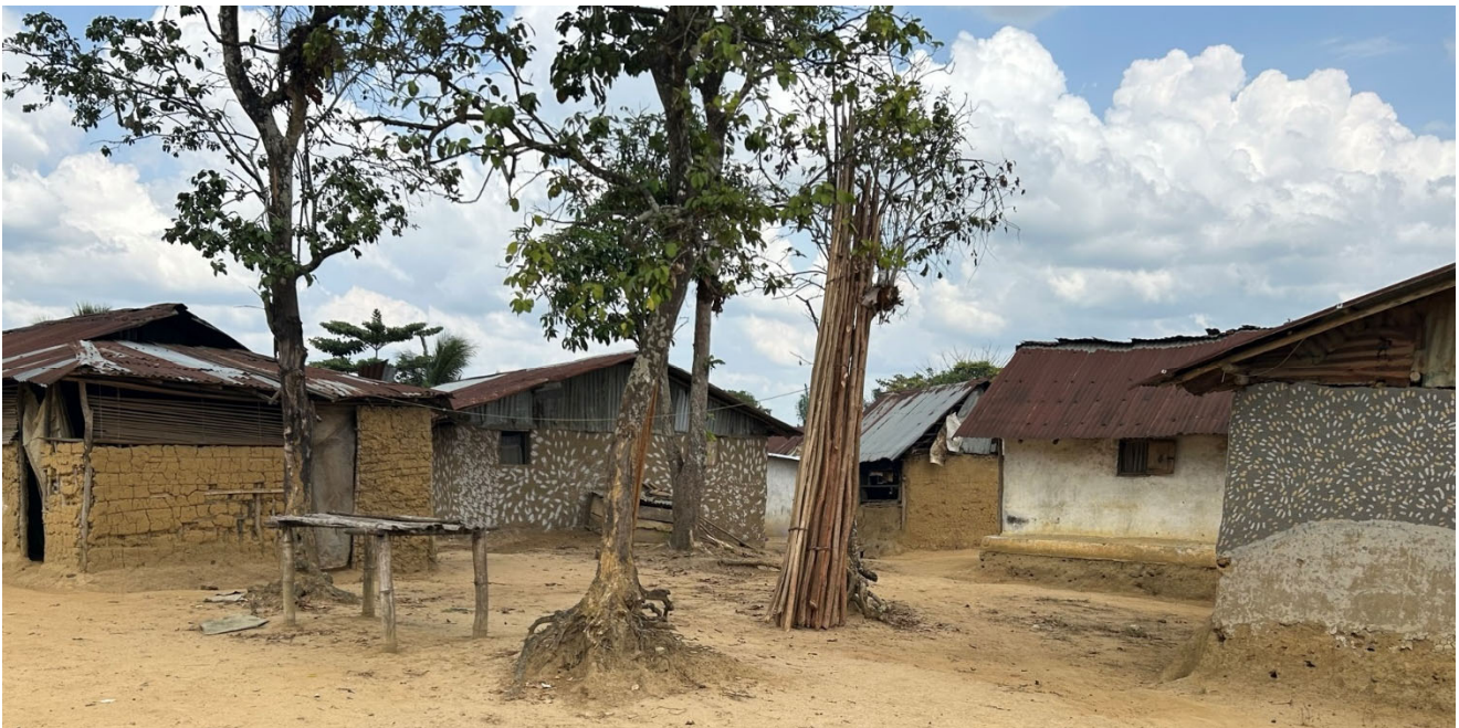
Dette er noen av de mer velholdte og solide landsbyhusene vi så på vår vei

I landsbyene er det vanlig å bo i et lite hus bygd av sandblokker eller mur. Huset brukes til å sove i, mens dagene tilbringes ute. Også maten tilberedes utendørs, gjerne under et lite stråtak i ly for regnet.