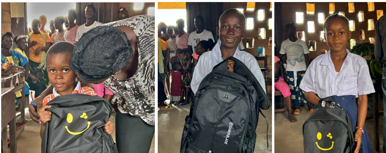
Utdeling av nye sekker og skoleutstyr fra GHTAC

Styret ser at det arbeidet som gjøres i Liberia fanger oppmerksomhet og at vår bærekrafts- og humanitære strategi treffer.