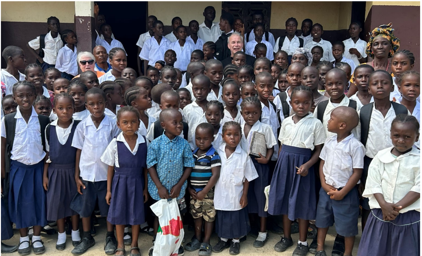
Elever som er i GHTAC sitt program

BNP i Liberia pr innbygger er ca 2,5 % av det Norske BNP!