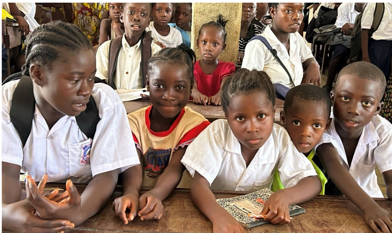
Det er stor iver etter å lære til tross for enkle kår, få hjelpemidler og trangt om plassene i klasserommene.

Det er alltid en positiv holdning når stiftelsen presenteres, men vi ser det er vanskelig å kjempe om interessen i en verden hvor det stadig er en ny katastrofal hendelse som fanger folks interesse.