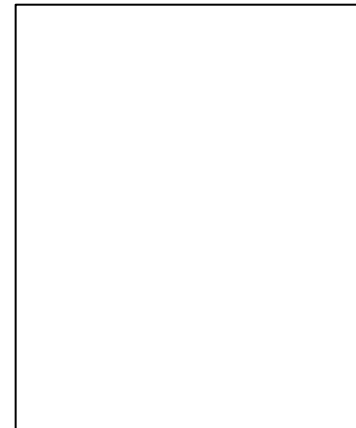
Nytt medlem ?